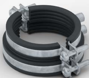
POLO-KAL dB+ bestående av stöd- och fästklämma