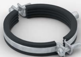
POLO-KAL dB Stålklämma med gummiinsats

När ljuddämpning står högst på kravlistan är POLO-KAL 3S Pro det självklara valet. Med tillägget av DN 50 täcker POLO-KAL 3S Pro som ett komplett system alla krav inom en fastighet. Rörsystemet blir ännu tystare med de nya rörsvepen POLO-KAL dB och POLO-KAL dB+ , som effektivt eliminerar stomljud och garanterar en tyst miljö.